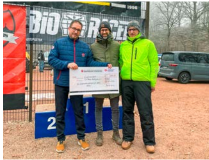
Neben dem SV Remse Radsport e.V. für seinen Remser Wintercrosslauf erhielten auch ...

Die jungen Kicker des SV Lok Glauchau-Niederlungwitz freuten sich über insgesamt zehn neue Fußballbälle und zwei Ballsäcke, die der Verein mithilfe des Zuschusses durch die Weihnachtsspende kaufen konnte. Gerade die 24 Kinder der F-Jugend haben großen Spaß mit dem neuen Trainingsmaterial. Da der Zuwachs in dieser Altersgruppe sehr groß ist, war der Erwerb der neuen