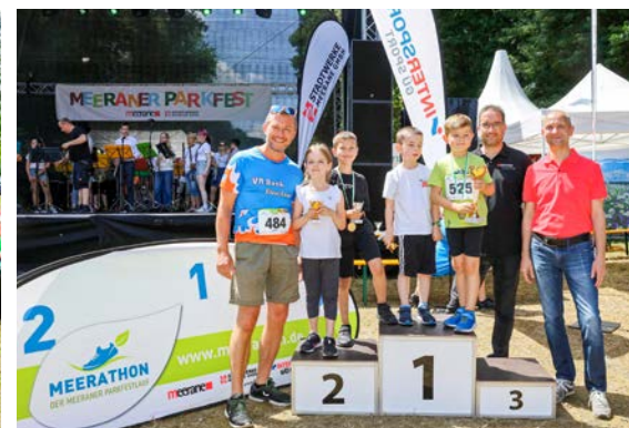
Impressionen aus zehn Jahren Meerathon: Freude am Laufen und am Dabeisein inklusive.