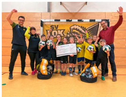
... der SV Lok Glauchau-Niederlungwitz für die Nachwuchskicker ...