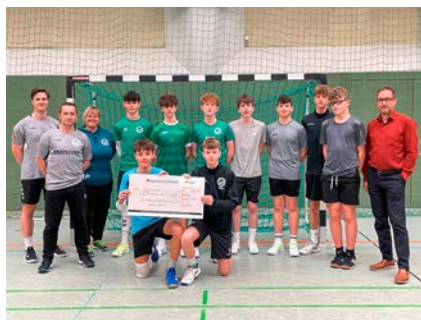
... und der HC Fraureuth für die Handball-C-Jugend eine Spende der Stadtwerke Meerane.

Bälle dringend nötig. Das dürfen die Kids nun beim Training und im Spiel genießen, damit auch künftig wieder Tore zum Sieg geschossen werden können.